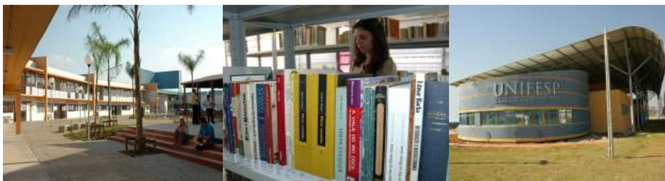
Área livre em Guarulhos, biblioteca do campus e fachada de São José dos Campos

Nos próximos meses, será divulgado o edital para licitação das obras e a Unifesp aplicará recursos cedidos pelo Ministério da Educação e Cultura (MEC) para disponibilizar o novo local de atendimento para a população. Estima-se que em menos de dois anos será possível utilizar a nova unidade como um centro prático de pesquisa e de aplicação do conhecimento acadêmico a serviço da comunidade.