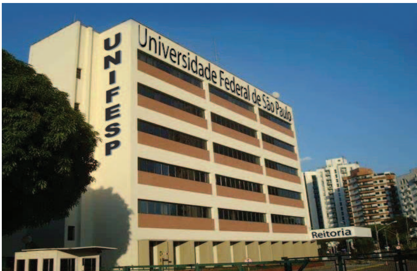
Novo prédio abrigará Reitoria, Pró-Reitorias e área administrativa da Unifesp

A Reitoria, Pró-Reitorias e área administrativa da Unifesp serão transferidas para novas instalações, na avenida Sena Madureira, 1500. O edifício de 6.800 m 2 , em frente ao parque do Ibirapuera foi adquirido com verba do Ministério da Educação e Cultura (MEC) para atender à política da atual Reitoria de levar a administração central da Universidade para um espaço independente da área de Saúde. "Ao mesmo tempo, a Escola Paulista de Medicina e demais cursos (Enfermagem, Ciências Biomédicas, Fonoaudiologia e Tecnologias em Saúde) comporão o campus da Vila Clementino com Diretorias e Conselhos, resgatando e preservando suas especificidades e