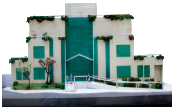
Maquete do Hemocentro da Colsan em São Bernardo do Campo

No próximo ano, também estará em operação o Hemocentro de São Bernardo do Campo, com uma área de 1,2 mil m 2 construídos com recursos próprios, que coletará 2,5 mil bolsas/mês, o equivalente a 20% da atual produção mensal da instituição.