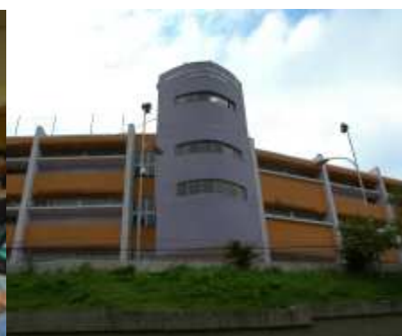
Instalações do campus Baixada Santista, auditório Marcos Lindenberg, na Vila Clementino, e campus Diadema